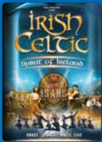
IRISH CELTIC 02 AVR. 2026