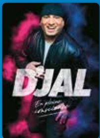
D'JAL 03 AVR. 2026