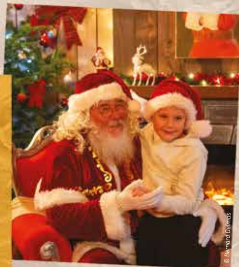
De nombreux enfants et leur famille ont pu rencontrer le Père Noël dans un décor chaleureux et repartir avec une photo souvenir inoubliable !