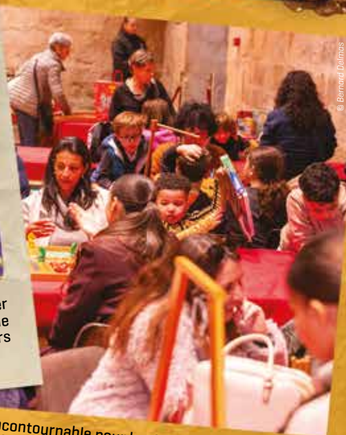
Lieu incontournable pour les familles, le Palais du Jeu a une fois de plus rempli sa mission : rassembler et divertir petits et grands.