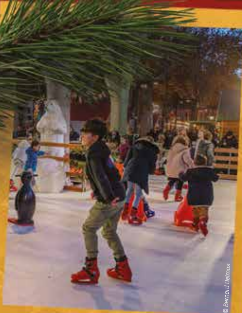
La fête foraine et la patinoire ont fait de nombreux heureux, surtout chez les plus jeunes, impatients de tester les attractions.