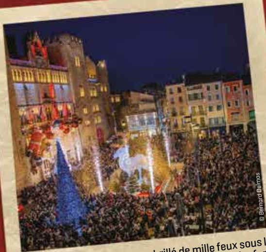
La place de l'Hôtel-de-Ville a brillé de mille feux sous les regards émerveillés d'une foule d'adultes et d'enfants venus assister au lancement des Féeries de Noël, samedi 29 novembre. Au programme : confettis, lumières scintillantes, concert.

Déambulations, mascottes, concerts, créations et produits artisanaux, manèges, jeux et bien sûr le Père Noël... Tous les ingrédients étaient réunis pour offrir des fêtes de fin d'année chaleureuses et étincelantes, du 29 novembre au 4 janvier.