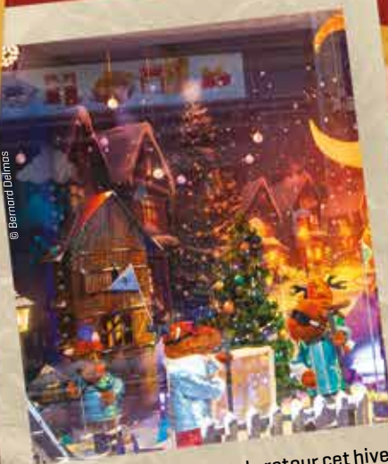
Les automates étaient de retour cet hiver et ont animé certaines vitrines de la rue du Pont des Marchands avec leurs décors ludiques et féériques.