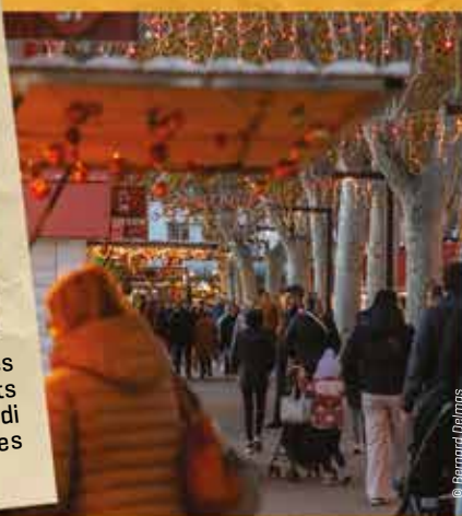
Les créations artisanales et culinaires du Marché de Noël ont remporté un franc succès sur la promenade des Barques qui s'animait tous les jeudis avec des concerts enchanteurs.