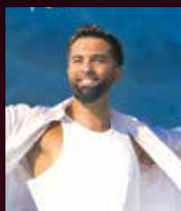
KENDJI GIRAC 10 JAN. 2026