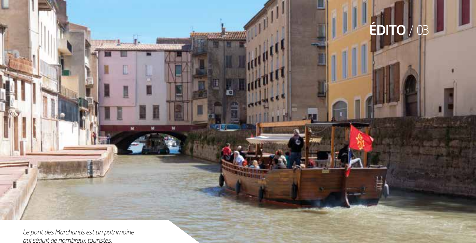
Le pont des Marchands est un patrimoine qui séduit de nombreux touristes.