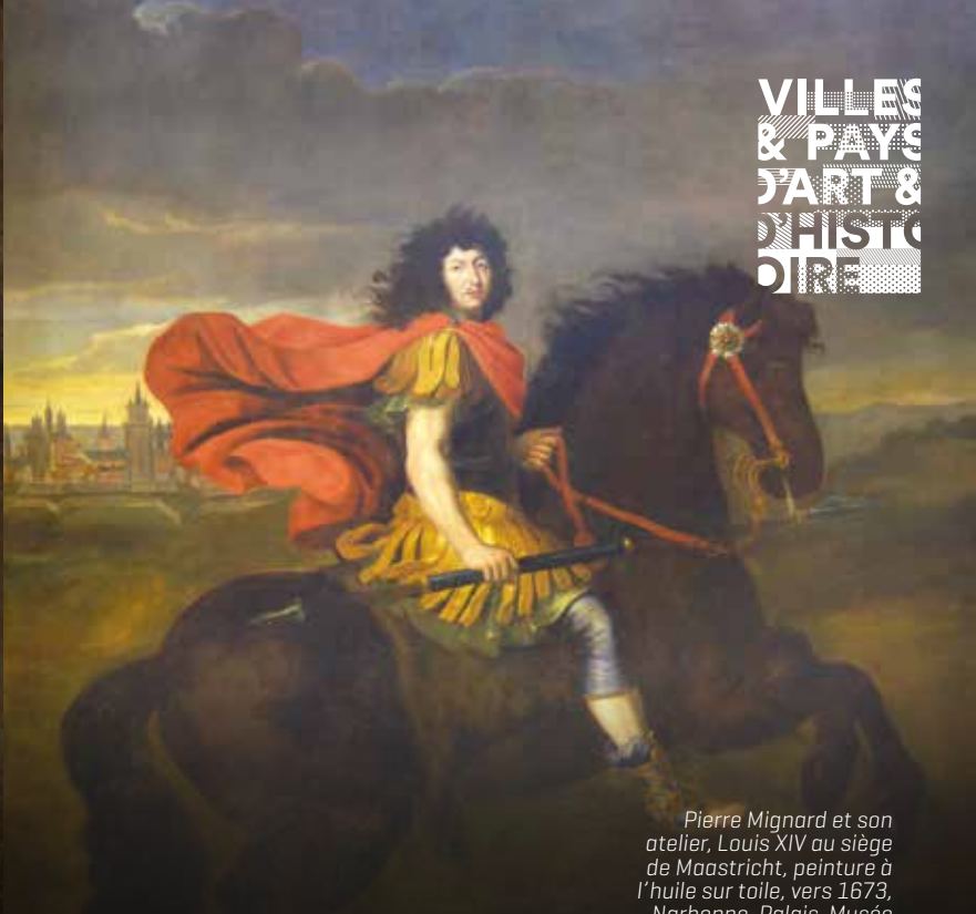
Pierre Mignard et son atelier, Louis XIV au siège de Maastricht, peinture à l'huile sur toile, vers 1673, Narbonne, Palais-Musée des Archevêques