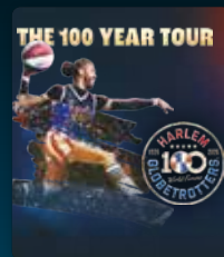
HARLEM GLOBETROTTERS 18 MARS 2026

ET D'AUTRES À DÉCOUVRIR SUR NARBONNE-ARENA.FR