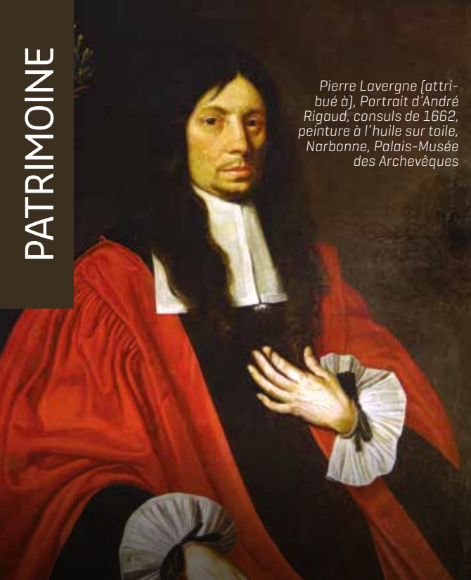
Pierre Lavergne [attribué à], Portrait d'André Rigaud, consuls de 1662, peinture à l'huile sur toile, Narbonne, Palais-Musée des Archevêques