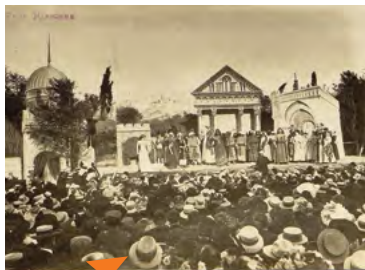
Le 4 octobre 1908, les arènes de Narbonne ont accueilli une représentation d'Hérodiade, opéra de MASSENET composé en 1881, organisée par l'Orphéon l'Avenir. Vous pouvez remarquer les musiciens de l'orchestre devant la scène (2 Fi 248).

Pour cette deuxième exposition virtuelle, les Archives municipales vous invitent à découvrir les arts et divertissements pratiqués à Narbonne depuis l'époque moderne, à travers une sélection de documents inédits.