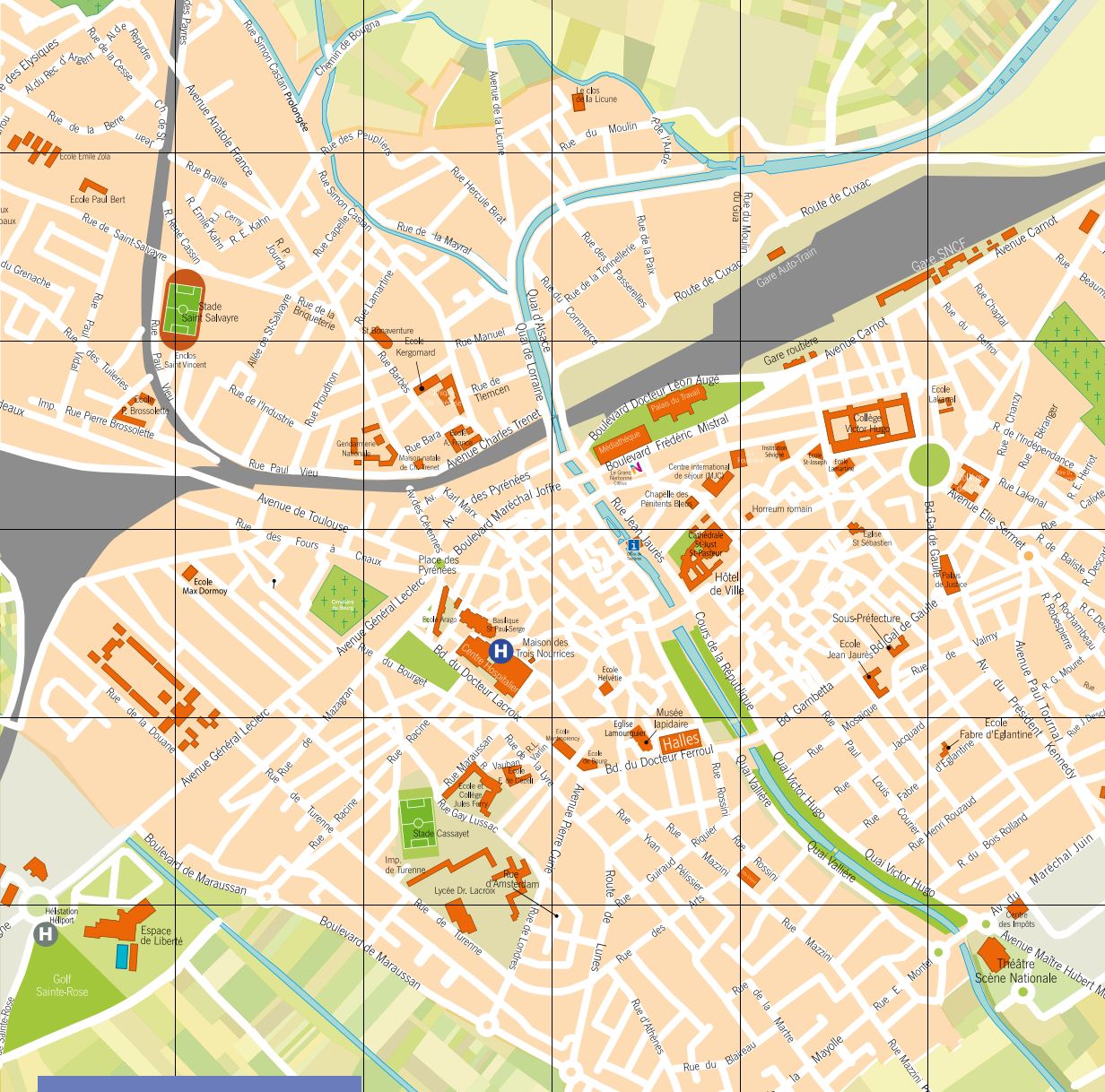
Plan du centre-ville de Narbonne