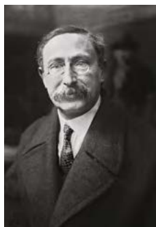
figure nationale du Front Populaire en 1936, était député de la circonscription de Narbonne de 1929 à 1940 . Il laisse une trace indélébile de son passage dans la mémoire locale.