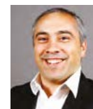
Yves Pénet 8 e Adjoint au Maire délégué à la culture, au patrimoine, aux musées et aux archives