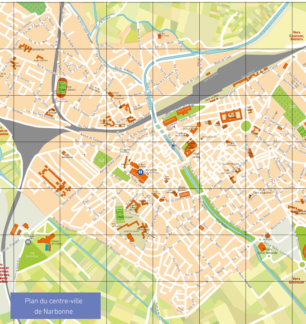
Plan du centre-ville de Narbonne