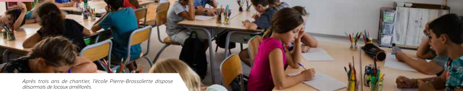
Après trois ans de chantier, l'école Pierre-Brossolette dispose désormais de locaux améliorés.