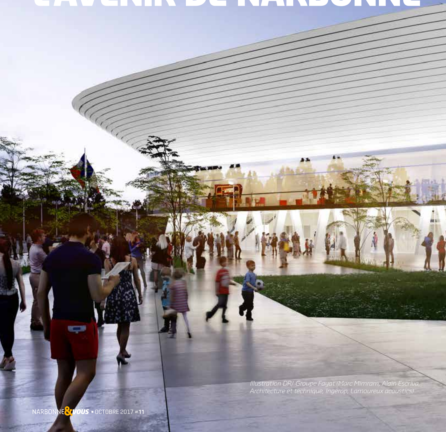
Illustration DR/ Groupe Fayat (Marc Mimram, Alain Escriva, Architecture et technique, Ingerop, Lamoureux acoustics)