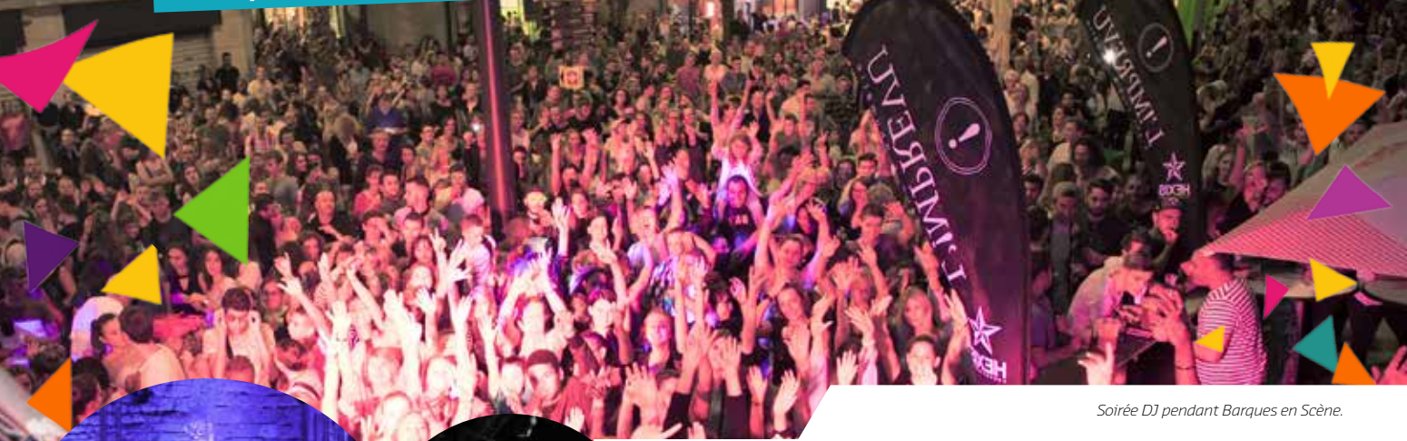
Soirée DJ pendant Barques en Scène.

Coup d'œil sur l'actualité récente et à venir !