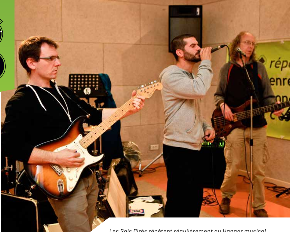
Les Sols Cirés répètent régulièrement au Hangar musical.

La structure offre de nombreux services afin de promouvoir la musique et la scène locale. Tour d'horizon.