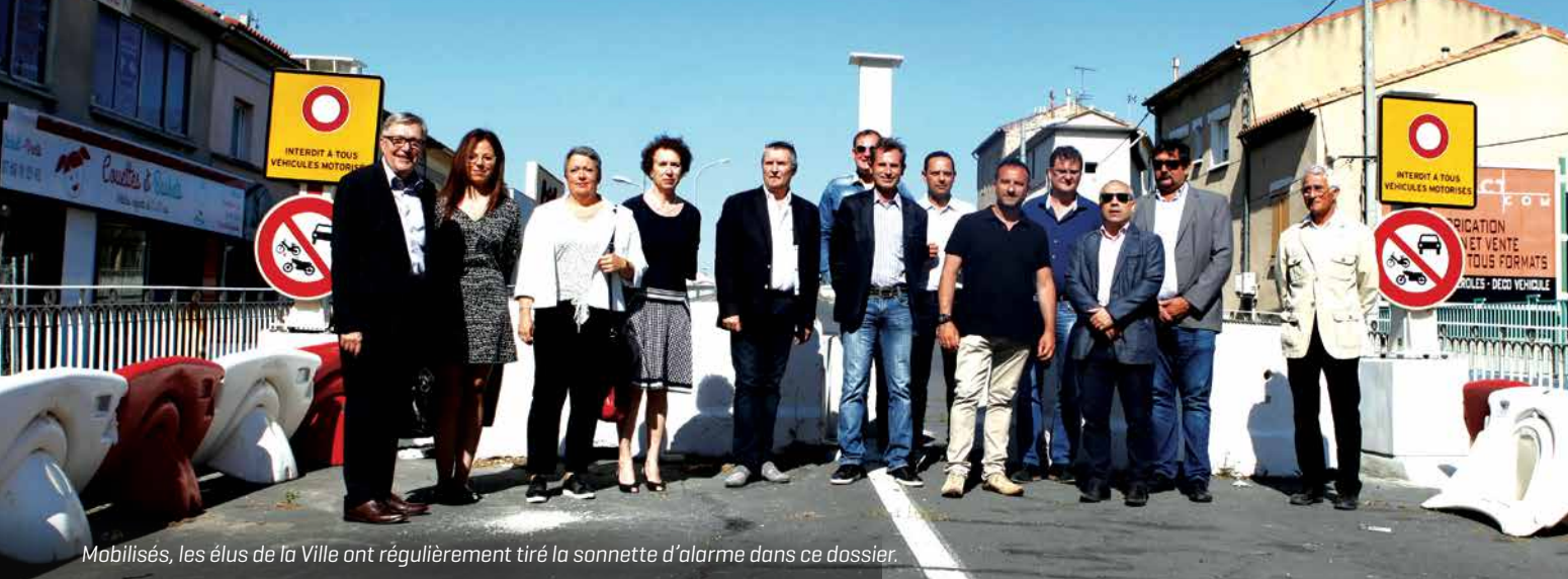
Mobilisés, les élus de la Ville ont régulièrement tiré la sonnette d'alarme dans ce dossier.

Deux ans après la fermeture de cette infrastructure par l'État pour des raisons de sécurité, des solutions sont enfin avancées, dont la possible réouverture provisoire dès 2017.