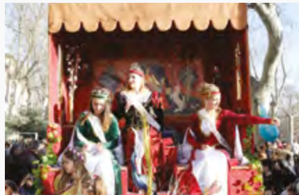
La Reine et ses dauphines 2017

En cas de report pour cause de mauvais temps, la sortie de Carnaval est prévue le dimanche 18 février.